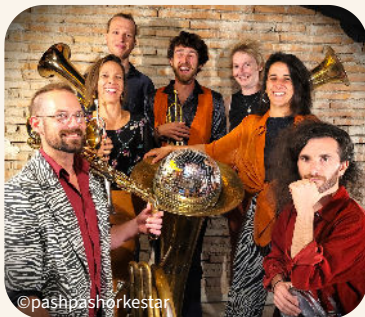
PASH PASH ORKESTAR